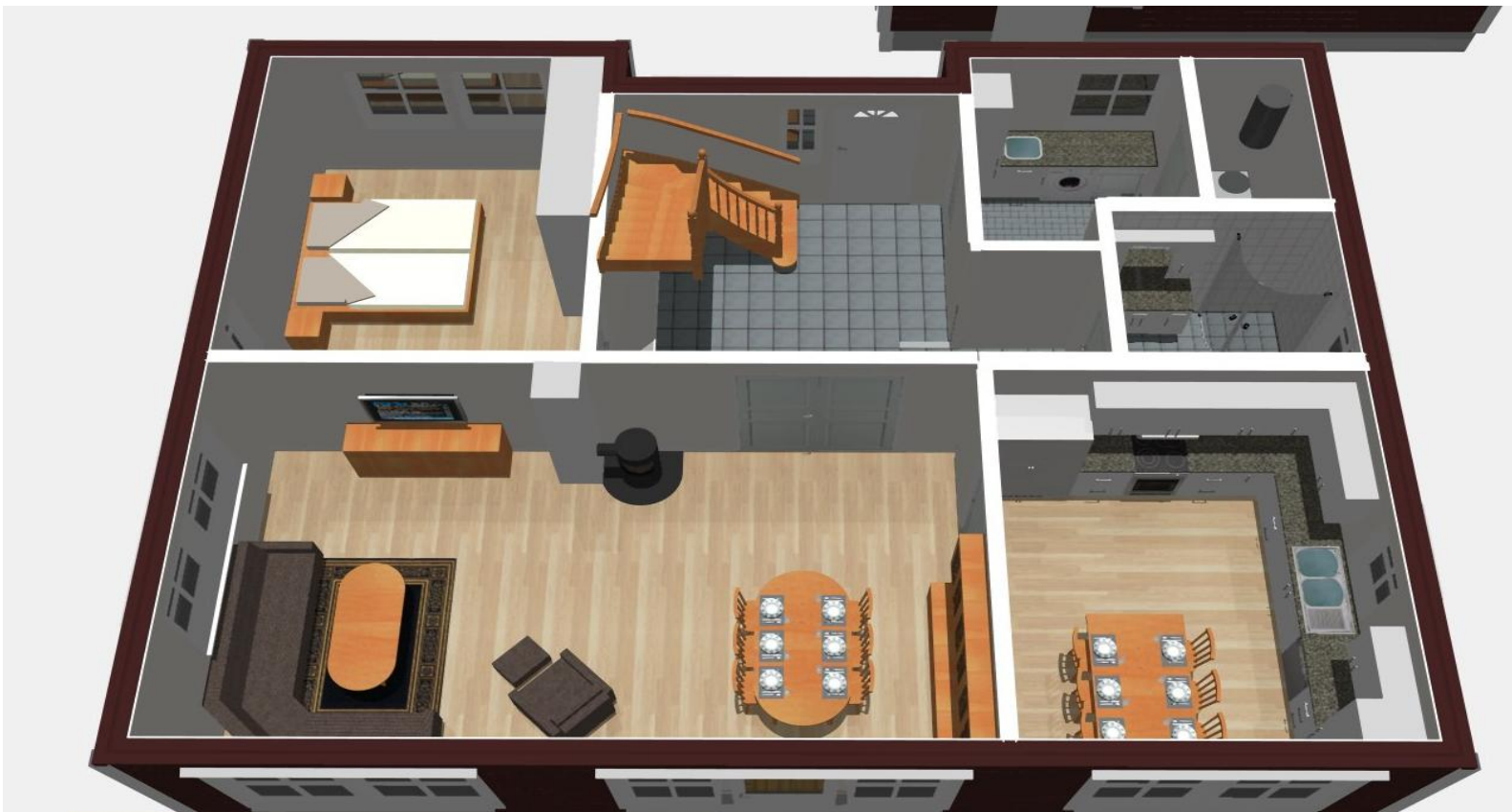
Illustrasjon romløsning 1.etasje og loftsetasje